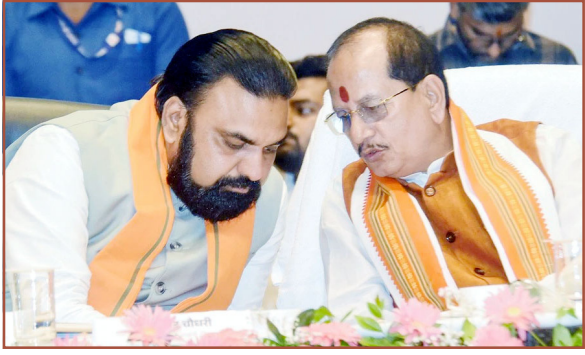
पटना ( संवाददाता )।

नीतीश कुमार कैबिनेट की आखिरी बैठक के बाद देंगे इस्तीफा, 15 अप्रैल को नई सरकार का शपथ ग्रहण संभव