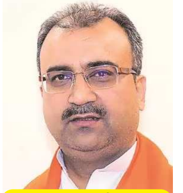
राहुल गांधी क्या बोलते हैं, उन्हें खुद...