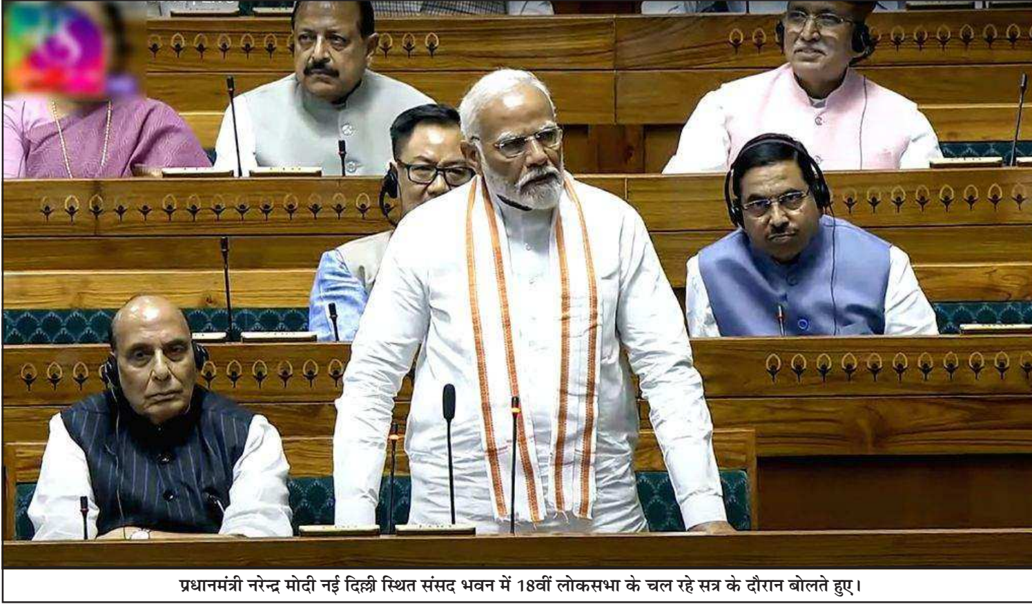
प्रधानमंत्री नरेन्द्र मोदी नई दिल्ली स्थित संसद भवन में 18वीं लोकसभा के चल रहे सत्र के दौरान बोलते हुए।