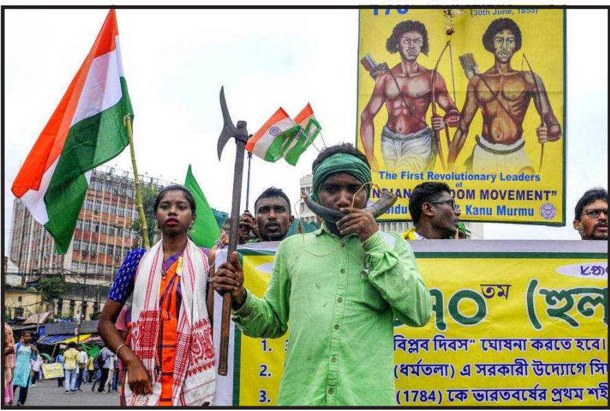
कोलकाता में भारत जकात संतर पथुआ गाँटा के सदस्य 170वें हूल दिवस के उपलक्ष्य में आयोजित रैली में हिस्सा लेते हुए।

गूगल मैप्स से उन्हें आगे एक संकरे सड़क होने का पता चला, जिसके बाद वे अपनी कार लेकर गए। बता दें कि गूगल मैप्स एक वेब सेवा है जो दुनिया